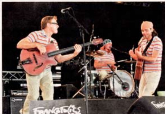
Les papas rigolos sur la scène des Francoboles de Spa.

"On peut faire des choses artistiques en province". Programmation, affiche, po-